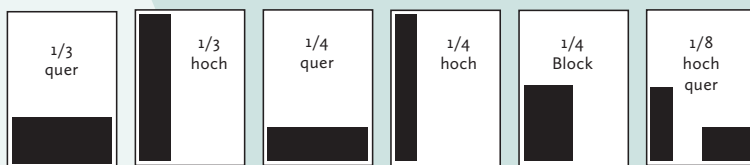
190 x 84 mm 200 x 94 mm 61 x 260 mm 66 x 300 mm 190 x 62 mm 44 x 260 mm 93 x 128 mm 44 x 128 mm 93 x 62 mm

Normal: Anzeige im Satzspiegel // Kursiv: Anzeige im Anschnitt (+ 3 mm Beschnittzugabe auf das angegebene Format)