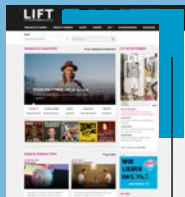
Wallpaper Anlieferung: Superbanner+Skyscraper