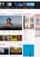
Rectangle 300 x 250 Pixel