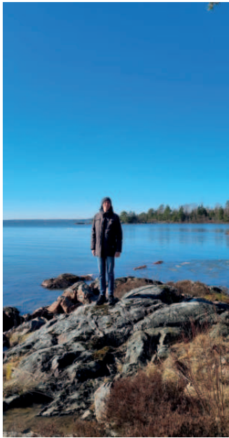
Süße Cafés und idyllische Natur